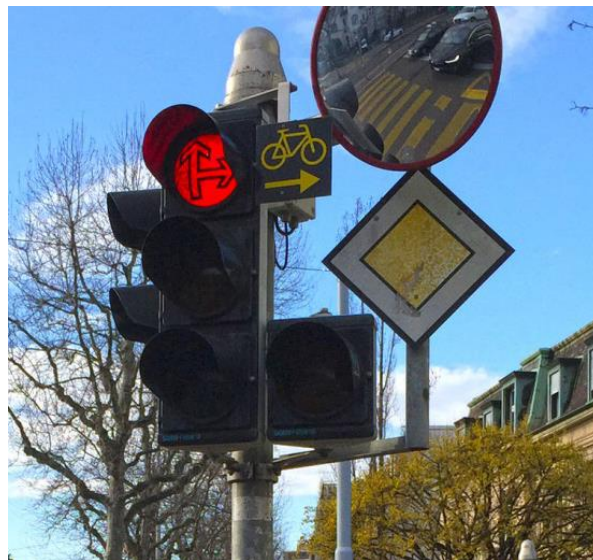
Abbildung 1: Signalisation für Freies Rechtsabbiegen bei Rot

Das freie Rechtsabbiegen bei Rot kann mittels einer einfachen Signalisation an den Ampelposten eingerichtet werden. Ist neben dem roten Licht das Signal «Rechtsabbiegen für Radfahrer gestattet» angebracht, dürfen Velos bei Rot nach rechts abbiegen, haben aber gegenüber den querenden Fussgängerinnen und Fussgängern weiterhin keinen Vortritt.