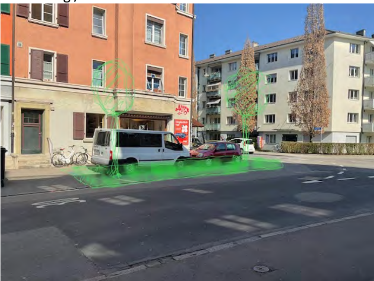
Öffentlicher Grund im Vorland