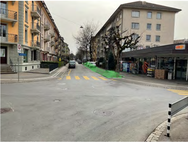
Zusammenfassen von Baumscheiben