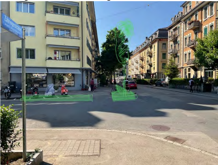
Reduzieren der übergrossen Kreuzungsfläche