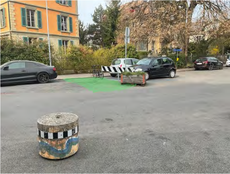
Begegnungszone, Wurzelbereich verbessern, übergrosse Verkehrsfläche reduzieren