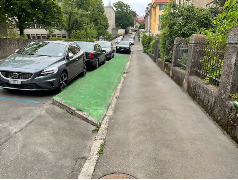
Aufheben eines selten benutzten Bypasses und Trottoirverbreiterung