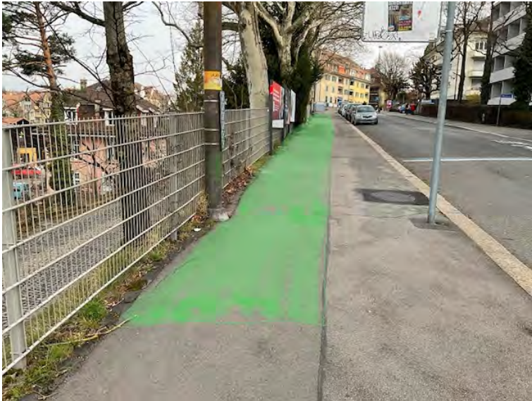
Eingeschränkter Wurzelbereich Defekter Belag