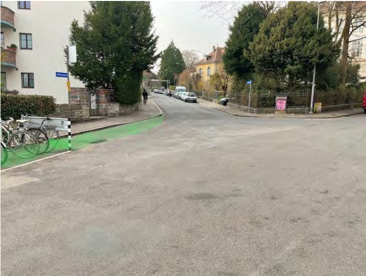
Reduktion der übergrossen Kreuzungsfläche