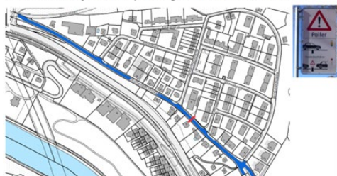
Variante 1: Physische Sperrung auf Reichenbachstrasse