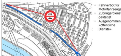
Variante 2: Fahrverbot Reichenbachstrasse